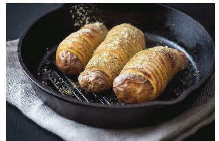
ハッセルバックポテト