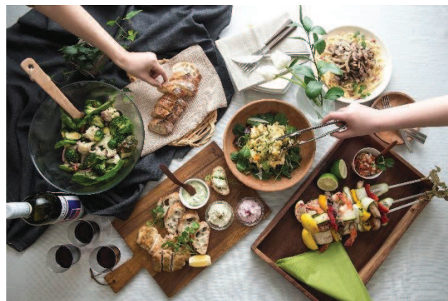
かける、あえる、とくす、つける 4つの使い方広がるレポート