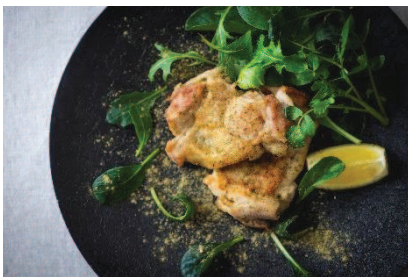
チキンのムニエル