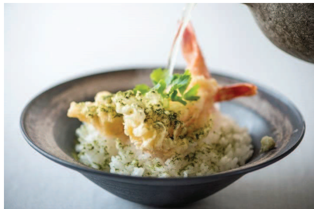
お湯をかけるだけでハーブティー茶漬けに！ 飲んだ後のシメにもってこいです

メディアの方には実際にご試食いただけます。サンプルをお送りすることも可能です。ぜひ貴社媒体でご取材お願いいたします。